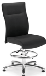
→ NEO LUX lb gts RB steel 05 chrome