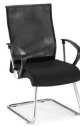
→ NEO LUX NET cfp chrome