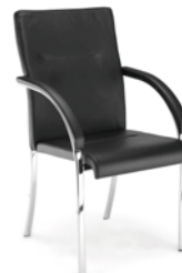
→ NEO LUX 4L arm chrome