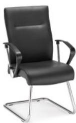
→ NEO LUX lb cfp chrome