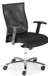
→ NEO LUX PL NET R1B steel 05 chrome + mechanizm Duetto Synchron/ MPD-165