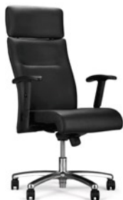
→ NEO LUX PL R1B steel 05 chrome + mechanizm Duetto Synchron/ MPD-165