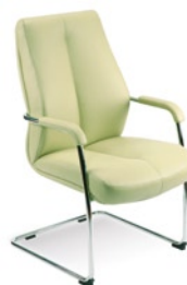
→ SONATA lux cf lb steel chrome