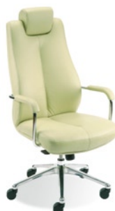
→ SONATA lux steel 28 chrome + Multiblock mechanism