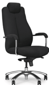
→ SONATA 24/7 steel 17 chrome + mechanizm Duetto Multiblock