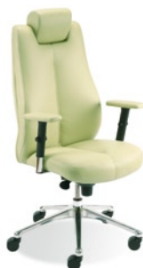
→ SONATA lux synchro R15 steel 28 chrome + mechanizm Epron Synchron